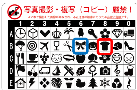
（図1）画像認証カード（例）