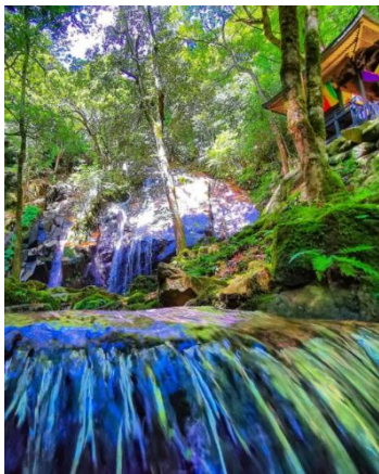
「金引の滝を見上げてみた!」