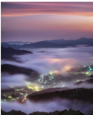
「与謝野雲海と朝焼け」