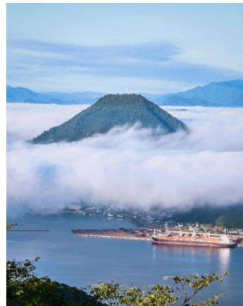
「五老ヶ岳公園からの大雲海」